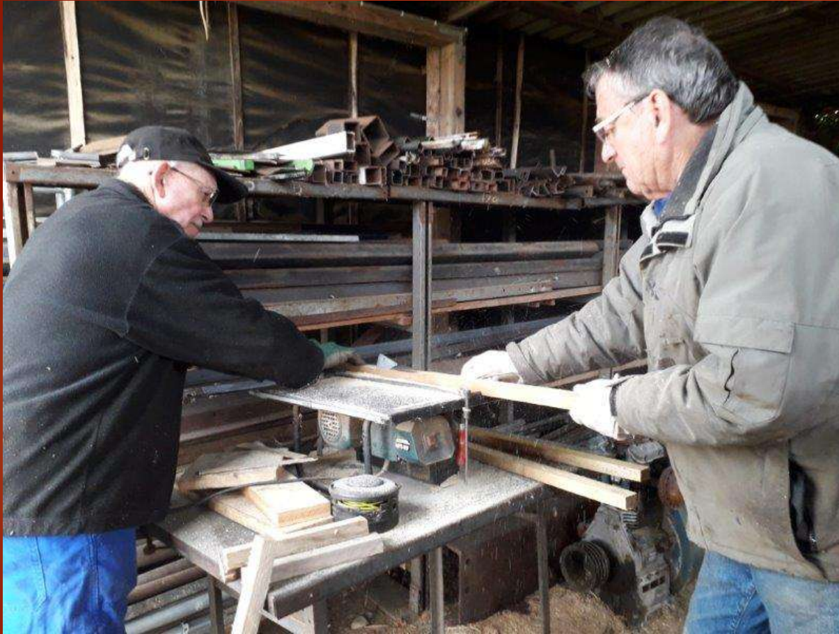
Découpe de tasseaux de bois adaptés aux ornières

L'autorisation d'ouverture du Musée au public est soumise à certaines conditions en particulier l'obstruction des ornières de rails